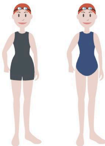
Figura 2. Exemplificação sobre os fatos permitidos para os nadadores cadetes e infantis femininos.